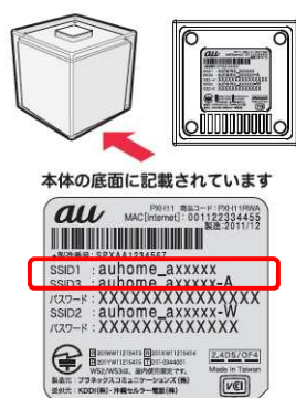
HOME SPOT CUBE ラベル例

「auhome_a×××××」(2.4GHz 用) または「auhome_a×××××-A」(5GHz 用) を選び、タップしてください。