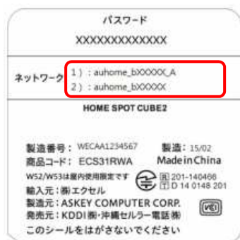
HOME SPOT CUBE2 ラベル例

「auhome_b×××××」(2.4GHz 用) または「auhome_b×××××-A」(5GHz 用) を選び、 タップしてください